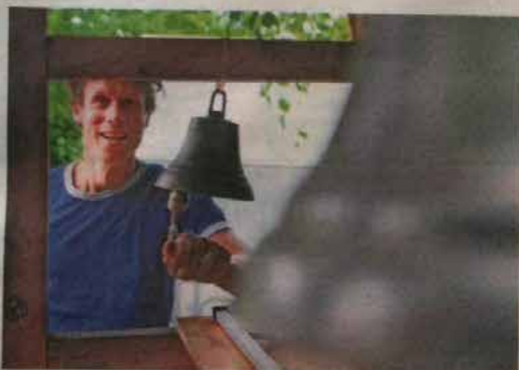
• Als Groen alle bewoners bijeen wil hebben, zoals voor het ontbijt, luidt hij de bel.