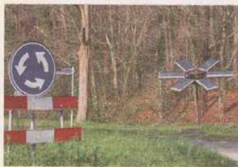
Het kunstwerk bij de rotonde op de Wageningse Berg.

De installatie is gemaakt door Erik Groen, een Wageningse kunstenaar. Hij maakte de Zonnebloem in 2012 voor de Floriade. Daar kon de bloem echte bloemen afschieten als hij opgeladen was. Daarna heeft de bloem op vele festivals gestaan waaronder de Molenmarkt in Wageningen. Nieuw is nu de groene ledverlichting die de bloem ook 's nachts zichtbaar maakt. Thuis op Ecodorp Wageningen levert de bloem stroom voor het dorp. Erik Groen heeft ook een Nieuwjaars column geschreven die u kunt lezen op erikgroenblog.wordpress.com .