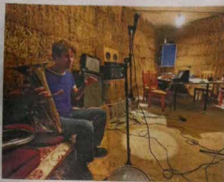
• De studio van stobalen waarin de band Grassmoower repeteert.

• In Wageningen leven tien mensen op een gekraakt ziekenhuisterrein